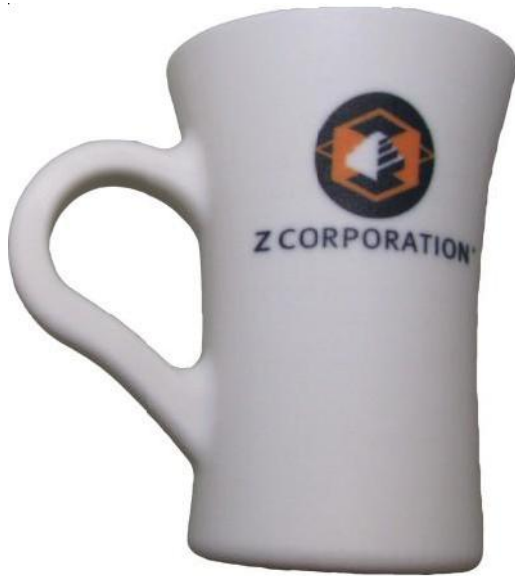
Zp 150 + Z-Bond

Infiltrace vodou se síranem hořečnatým je nejlepší způsob jak snadno a rychle finalizovat koncepční modely. Už není třeba používat nebezpečné chemické materiály. Jednoduše rozpusťte síran hořečnatý ve vodě z vodovodu a sprejem jemně nastříkejte váš model. Poté chvíli počkejte, aby došlo k vysušení, zpevnění a vybělení vašeho modelu. Tento způsob můžete použít pro všechny modely vytištěné z prášku zp 150. Pokud však chcete docílit zářivějších barev, doporučuje se infiltrace Z-Bondem.