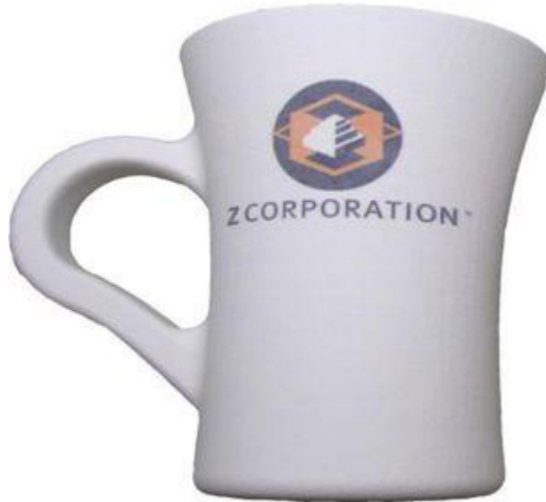
Zp 150 + voda se síranem hořečnatým